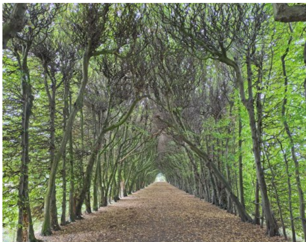
Allee Schloss Eisjeden

Die Landschaft Richtung Bassenge wird sehr hügelig, Steigungen bis zu 15 % sind keine Seltenheit. Auf dem Rückweg geht es über Serpentina bergab über die alte Brücke „Pont de Lanaye“, wir pausieren in einem urigen Café im gleichnamigen Ort, auf alle in der Nähe befindlichen Kriegsdenkmäler verzichten wir. Mit einer Fahrradfähre Richtung Eisjeden über die Maas gelangen wir wieder nach Holland.