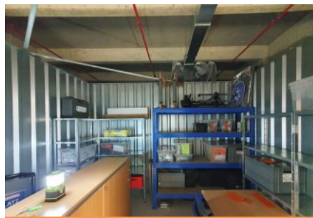
Der neue Lagerraum

Der Vorstand hat sich deshalb entschieden, die Geschäftsstelle aufzulösen und stattdessen einen geeigneten Lagerraum zu mieten. Die Wahl fiel auf Storage Friends im Ringcenter am Berliner Platz. Dort wurde ein 10 m 2 großer Raum gemietet.