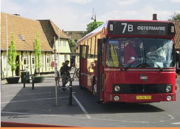
Bus auf Bornholm, Foto: Torsten Wenz

Traumpartner*innen für Ihre nächste Tour. Die Plattform ist offenbar stark nachgefragt. Bei Redaktionsschluss lagen 400 Einträge vor.