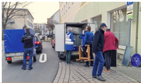
Viele Helfer packen beim Umzug mit an

Ende März 2023 hat der ADFC Braunschweig seine Geschäftsstelle im Magniertel aufgelöst. Im Jahr 2013 war sie mit viel Enthusiasmus am Klint 20 bezogen worden. Renovierungen wurden durchgeführt und ein Büro-Arbeitsplatz eingerichtet. Große Tische nebst Stühlen für die Arbeitskreissitzungen wurden beschafft. Zeitweise war sie ein- oder zweimal wöchentlich als Infoladen für den Publikumsverkehr geöffnet. Dieser Service musste allerdings später eingestellt werden, weil die ehrenamtlich Tätigen dafür die Zeit nicht mehr aufbringen konnten. Im Wesentlichen wurde die Geschäftsstelle aber für die Arbeitskreissitzungen und als Lagerraum genutzt. Schon vor der Coronakrise kam der Gedanke auf, ob es noch sinnvoll ist, so eine relativ kostspielige Geschäftsstelle zu betreiben. Während der Coronapandemie erwiesen sich die Räumlichkeiten als gänzlich ungeeignet, da sie für Arbeitskreissitzungen zu klein waren.