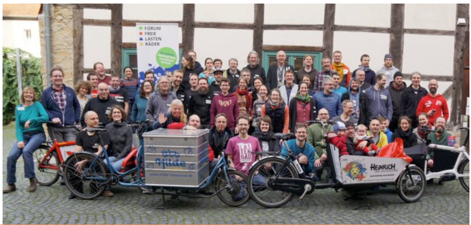
Teilnehmerfoto vom Forum Freie Lastenräder 2020