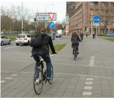
Per Rad zur Arbeit: immer beliebter