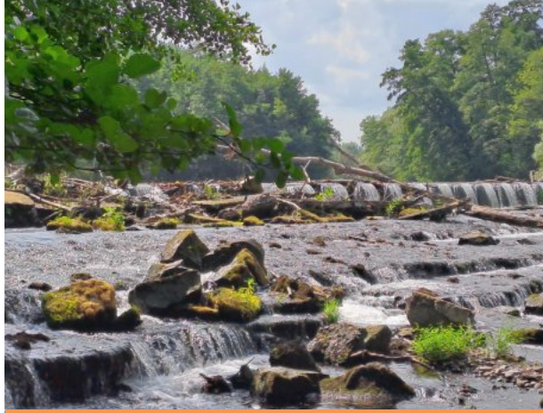
Die Rur bei Düren

Die erste Etappe des Tages verläuft durch bewaldetes Gebiet Richtung Rurberg. Landschaftlich prägen der maleisch inmitten des Nationalparks Eifel gelegene Rurseesee und das idyllische Rurtal die Tour. In Rurberg entscheiden wir uns für den Weg am linken Ufer der Rurtalsperre, der zweitgrößten Talsperre Deutschlands, die diesen Sommer wirklich wenig Wasser hat. Nach ca. 45 Kilo-