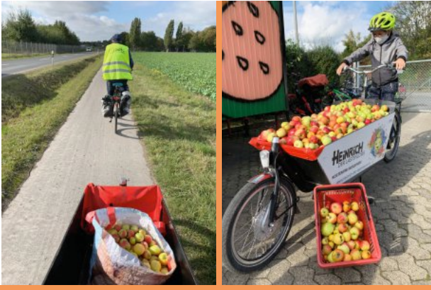
Der Apfeltag mit dem Lastenlöwen